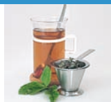
Tee ohne Zucker