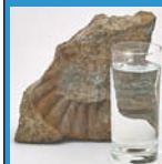
Wasser Leitungs- oder Mineralwasser